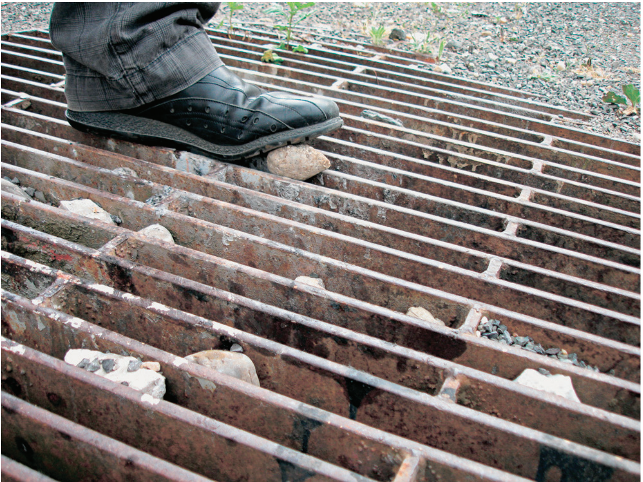
Upchávajúce dier, upchávajúce dier v areály Tranzitu, v rámci festivalu Multiplace 2007, Bratislava