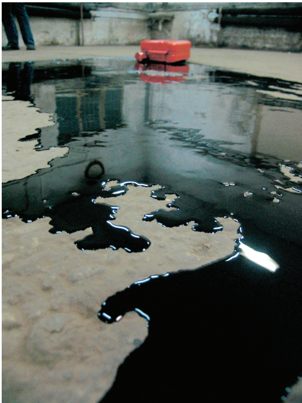
Ropa (detail), 10 litrov surovej ropy rozliatej na podlahe v rámci výstavy "Tomu ver Ty...", Tranzit dielne v Bratislave, 2004