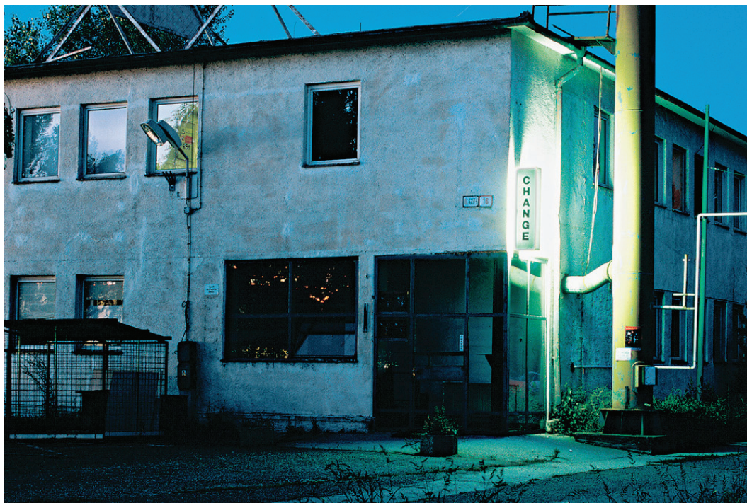
CHANGE, 2006–2007, akcia s výmenou použitých bankoviek za nové, lightbox na fasáde Tranzit ateliérov v Bratislave ako permanentná inštalácia