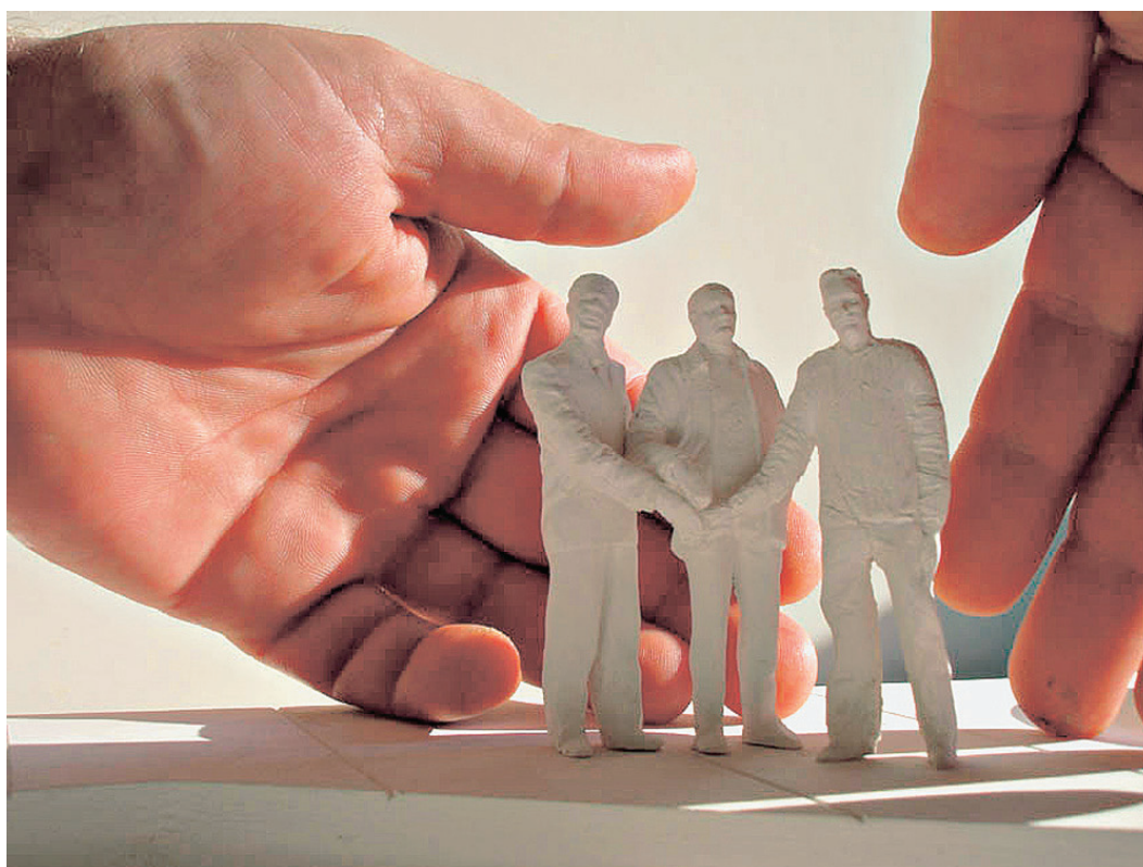
Multi Residents, figúrky-autoportréty darované priateľom, dokumentované nimi po niekoľkých rokoch, 2007, foto: Roman Ondák

na druhej strane pripomínajú tvar chromozómu XY, čo naznačuje aj názov diela a opäť tým evokujú myšlienku klonovania. Identitou jednotlivca v tej najintímnejšej sfére – koži, sa zaoberajú aj niektoré samostatné diela Milana Tittela, napr. dielo Vakcinácia (2006), vystavené v rámci billboardového projektu Donau Monarchie. Aj keď väčšina diel vychádza z konceptu plasticity, založenom na bezprostrednom hmatovom kontakte, XYZ transformujú hmotu v procese digitalizácie a viaceré svoje „sochy“ prezentujú ako fotografie. Tieto vznikajú na základe intervencie do rozmanitých prostredí a nepatrným označením reálneho prostredia zaznamenávajú, menia a posúvajú hierarchie vzťahov.