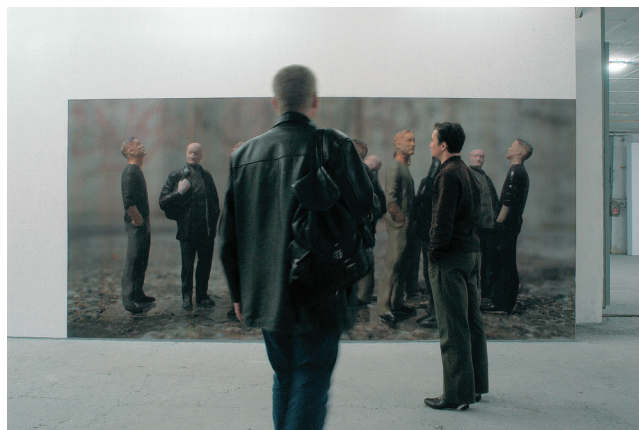
Trojitá prítomnosť, fotografia miniaturných autoportrétov zväčšená do rozmeru billboardu, 2005