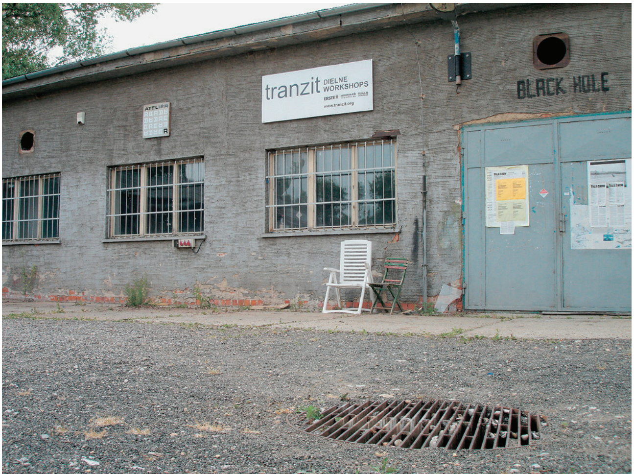
Upchávanie dier, upchávanie dier v areály Tranzitu, v rámci festivalu Multiplace 2007, Bratislava